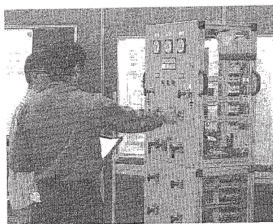
模擬操作盤を使用して作務体験の様子

中部電力岡崎支店は16、19日の4日間わたり、岡崎市戸崎町の同支店内の岡崎給電制御所、供給電圧7千ボルト以上の顧客企業の電気担当者を「顧客企業向けに「安全操作教室」 「安全操作教室」 対象にした「安全操作教室」を開催している。同支店は、電力の安定供給をめざし、人為的なミスによる停電などを未然に防止するため、半年に1度のペースで同教室を実施